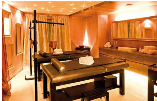
Behanglungsraum-Ayurveda – Alpenrose, Lermoos