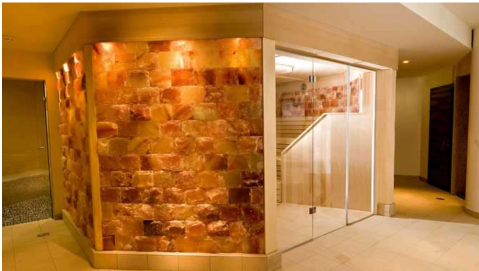
Salzstein Sauna – Alpenrose, Lermoos

Weiters laden zum Verweilen verschiedene hell gehaltene Lounges und Vitamin Bars im modernen Stil mit bequemen Möbeln und eleganten Accessoires ein. Für den Frischekick sorgen unter anderem Grünoasen im Inneren.