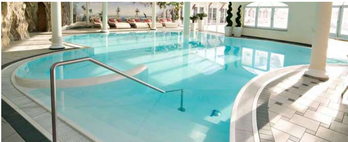
Poolarea – Alpenrose, Lermoos