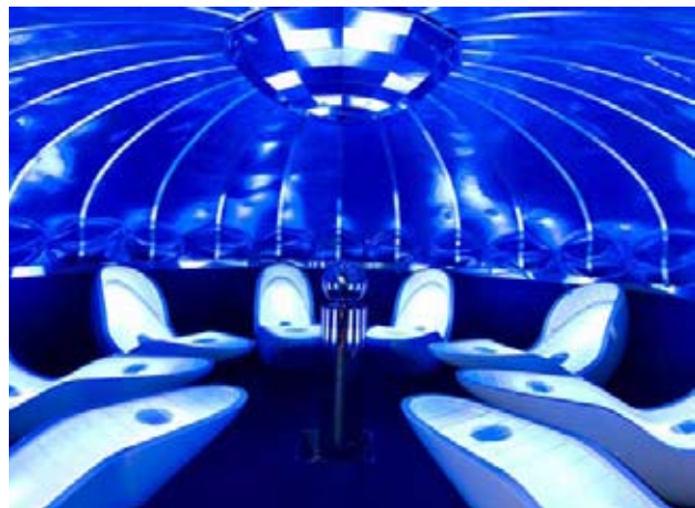
4 Senses-Spa Zone – Alpenrose, Lermoos

Herzstück des neuen Ruhebereichs ist die futuristisch anmutende 4 Senses-Spa Zone. Eine geschwungene Glaskuppel über den acht im Kreis aufgestellten 4 Senses Loungern erzeugt ein Gefühl der Geborgenheit. Die 4 Senses-Spa Zone setzt auf eine Tiefenentspannung bei der vier Sinne angesprochen werden. Bereits beim Betreten des weichen Bodens innerhalb der 4 Senses-Spa Zone merkt der Gast, das sich hier alles ums Wohlfühlen dreht.