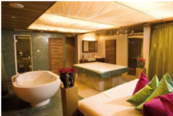
Behandlungsraum – Alpenrose, Lermoos

Schon bisher setzte das Hotel Alpenrose neben der Spezialisierung auf Kinder auf eine umfangreiche Wellness- und Beautyausstattung. Die bestehende Anlage – ein älterer Bestand und ein bereits erfolgter, moderner Zubau – wurden mit weiteren Attraktionen im Wellness und Beauty Bereich erweitert.