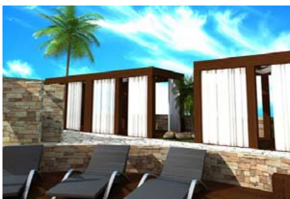
Terraza sobre techo – Oceana Resort, Dubai

Una espectacular zona de spa diseñada en un complejo hotelero, destacando las dos torres, las cuales están conectadas por un puente aquarium de cristal. El hotel estará situado al cabo de la Palmera Jumeirah y destacará el spa Thalasso, el más grande del Oriente Medio. Además, un club de casa spa será diseñado directamente a la playa. Esto ofrecerá numerosas ofertas de instalaciones de spa innovadoras.