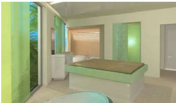
Tratamiento "Neptun" – Oceana Resort, Dubai

La terraza dispone de una vista magnífica, la cual puedes disfrutar mientras estás siendo mimado con una gran variedad de masajes en el exterior. En el Domo de Sal los visitantes pueden escoger desde los tratamientos de mangas de sal, peelings de sal, inhalación de sal y baños de sal.