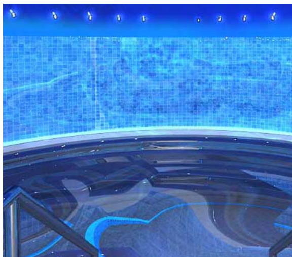
Piscina flotarium – Oceana Resort, Dubai

El toque absoluto del complejo es el puente de cristal conectado a las dos torres. El puente se caracteriza por la gran piscina con varias atracciones especiales como camas hidromasajes bajo el agua, masajes de chorros en el cuello, masaje de chorros de reflexología podal, masaje de chorros en todo el cuerpo, así como una piscina separada de masajes de agua. Para crear algunos tipos de efectos de acuario, los dibujos del océano y sus habitantes del mundo submarino son proyectados en los cristales. Las imágenes pueden ser vistas desde el interior y del exterior. El tema central del océano es recurrente en todas partes de la zona de spa.