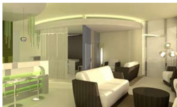
Recepción – Oceana Resort, Dubai

Nuestro mayor desafío fue que la piscina interior era demasiado pesada para ser sostenida por el cristal construido. Así pues desarrollamos una solución complicada tecnológicamente, reduciendo el peso de la piscina utilizando una construcción de acero inoxidable. Esto resultó en la creación una única piscina en altura vertiginosa.