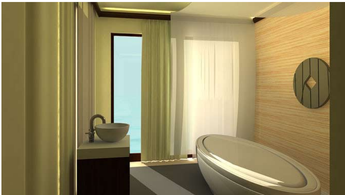
Holistic Cocooning – Royal Amwaj, Dubai