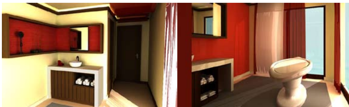
Ayurveda – Royal Amwaj, Dubai