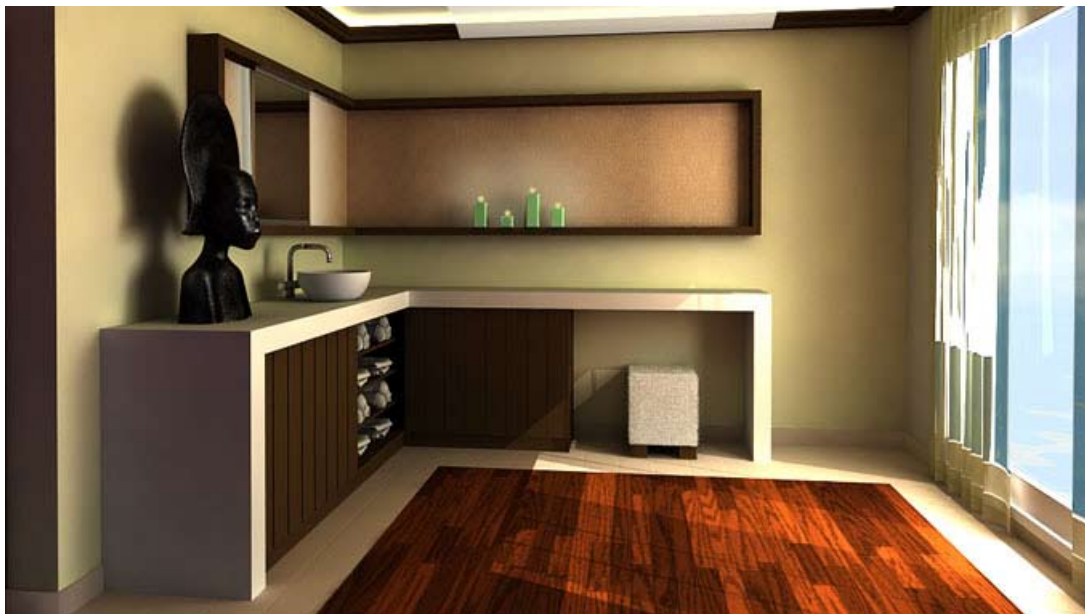
Habitación cosméticas – Royal Amwaj, Dubai