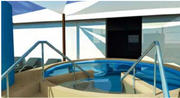
Piscina exterior – Royal Amwaj, Dubai

Sus instalaciones de duchas multi-sensoriales, baño de vapor / baños seraglio, masajes podales y masajes de espuma con manoplas, así como belleza, piscina y zona de shiatsu, las cuales pueden disfrutarse en privado. Las otras spa villas ofrecen varios masajes, body cocooning, Ayurveda y tratamientos especiales de la casa.