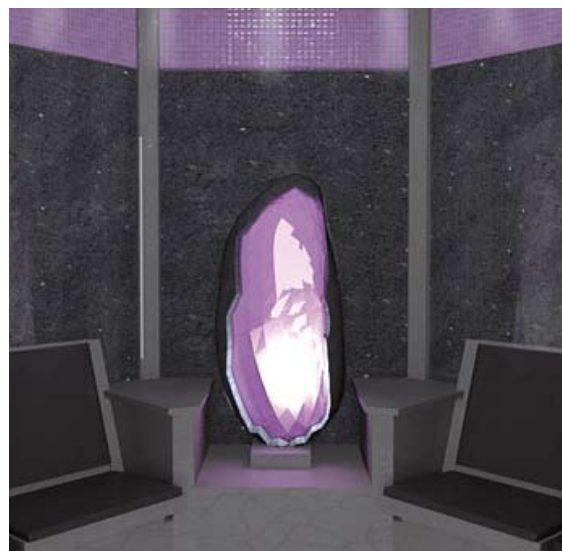
Baño de vapor cristal – Royal Amwaj, Dubai

El puente exterior conduce a las villas spa, donde se ofrecen los tratamientos holísticos y las extraordinarias terapias. Tres de las siete villas spa son diseñadas como única suite de tratamientos de lujo. Tienen todos nombres Balineses como penanganan yangmehwah o mandi perkawinan y significan total relajación en una atmósfera privada.