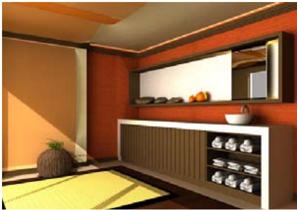
Habitación masajes y shiatsu – Royal Amwaj, Dubai

El Royal Amwaj está situado sobre el arco que rodea el Jumeirah Palm y es diseñado para ser un escondite en el Lejano Oriente – estilo Balinés. El Spa Village incluye el edificio principal y siete villas adyacentes que ofrecen una gran variedad de tratamientos. Las villas son construidos en el agua y accesibles a través de un puente exterior. Este spa de alto nivel atrae con auténtico estilo del Lejano Oriente. Las características instalaciones de la cultura Asiática han sido integradas en el spa de un modo innovador y armonioso.