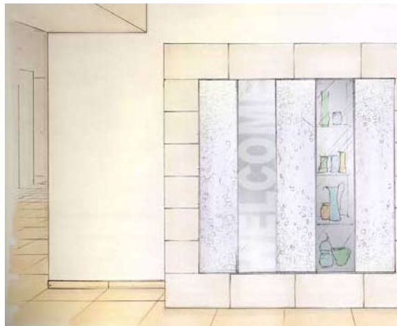
Eingang Hotel-Herren – Dammam, Saudi Arabien

Besonderes Augenmerk lag hier bei der strikten Geschlechtertrennung. So wurden 2 verschiedene Eingänge geplant, einerseits von draußen zugänglich und andererseits vom Hotel direkt, wobei auch dieser für Männer und Frauen getrennt ist. Mit besonderem Fingerspitzengefühl und Verständnis für die kulturellen Feinheiten ging das Planerteam von Schletterer Wellness & Spa Design auf diese Notwendigkeit ein und entwickelte kreative Lösungsvorschläge sowie spannende Designkonzepte.