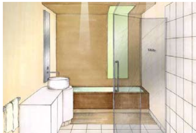
Dry Floatation-Herren – Dammam, Saudi Arabien

Es finden sich zahlreiche Möglichkeiten das einzigartige Wohlfühlerlebnis zu spüren, zu erleben: Ladies Beauty Zone, Shiatsu, Luxus treatment, Dry floatation bath, Kosmetikbehandlungen, Massage, Thalasso Bäder, Solarium, Ayurveda Massage / Aromatherapie / Schlammanwendungen, Pool. Entspannungszone / Ruheflächen, Laconium / Tepidarium, Kräuterbad, Erlebnisduschen, Eisgrotte, Dampfbad, Salzgrotte, Sauna / Jacuzzi