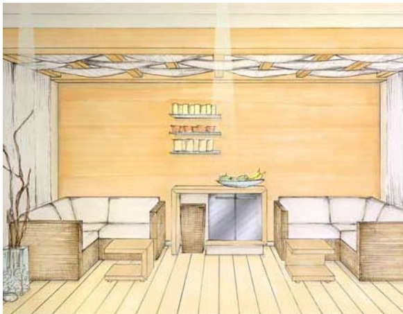
Lounge-Damen – Dammam, Saudi Arabien

Die Hafenstadt Dammam, fünftgrößte Stadt Saudi Arabiens ist nicht nur für Ihre Kultur, sondern auch die Einzigartigkeit der Landschaft bekannt. Ein Ort, an dem sich Kulturgenuß und Erholung in besonderer Weise verbinden lassen. Genau dort befindet sich das Sheraton Dammam.