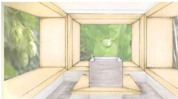
Kräutersauna-Herren – Dammam, Saudi Arabien

Beim aromatischen Kräuterbad in hellem Holz gehaltenen mit großflächigen Blumen-Bildmotiven dekorierten Raum oder bei einem erholenden Thalasso Bad im Infinity Pool, bei dem man von einem kokonartigen Raum umgeben ist, der gekonnt durch Einsatz von Lichtreflexen, Spiegeln und farbig abgestimmten Steinelementen beruhigend wirkt – der Aufenthalt im Wellness & Spa Bereich des Sheraton Dammam bleibt unvergessen.