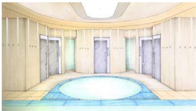
Therme-Damen – Dammam, Saudi Arabien