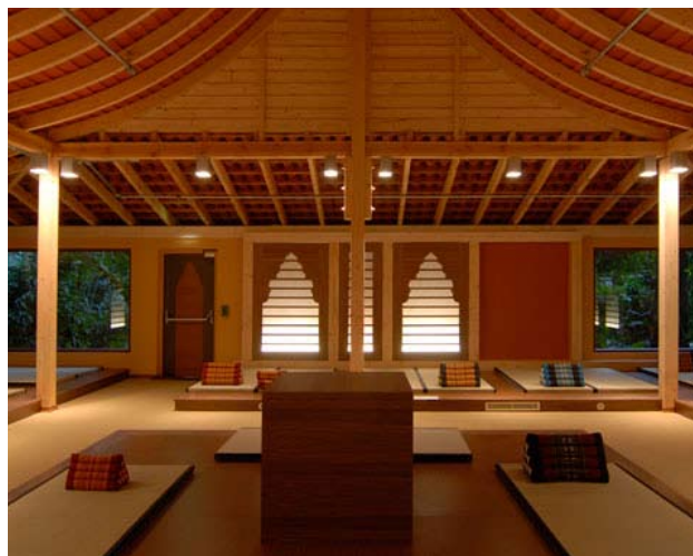
Asia-Pavillion – Tropical Islands, Krausnick

Im asiatischen Ruhehaus – mit gedämpften Licht und meditativer musikalischer Untermalung – können seine Besucher die Ruhe genießen und sich ausgiebig entspannen. Neben dem asiatischen Pavillon erreicht der Besucher einen dem Original nachempfundenen Teil der Tempelanlage von Angkor Wat. Aus dieser gigantischen Tempelanlage in Kambodscha wurde ein Teil von Ta Phrom mit den rudimentären Resten einer Würgefeige ausgewählt. Hier wurde eine Erdsauna und in den beiden offenen Randbereichen verschiedene Erlebnisduschen sowie ein Sprühnebelgang eingerichtet.