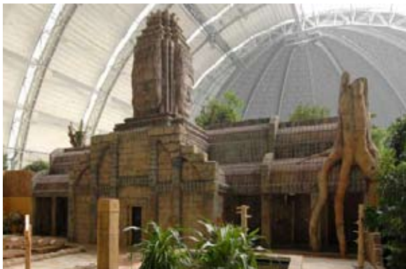
Angkor-Vat – Tropical Islands, Krausnick

Errichtung eines tropischen Dorfes, das sich thematisch in die Bade-, Freizeit und Entertainmentwelt der Halle eingliedert. Die einzelnen Wellness- und Spa-Angebote befinden sich in extra Gebäuden, welche einem speziellem Motto unterstehen. Der dazwischen befindliche Tropenwald vereint die Wellnesslandschaft unter seinem grünem Dach.