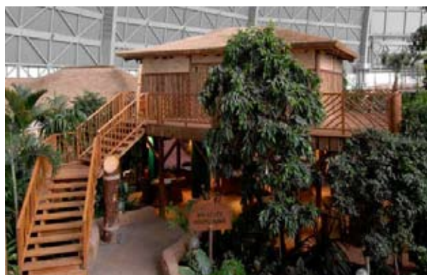
Dschungeldorf – Tropical Islands, Krausnick